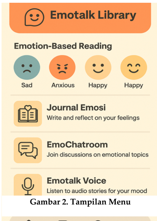
Gambar 2. Tampilan Menu

Emotalk Library dikembangkan sebagai platform digital konseptual yang menekankan integrasi literasi afektif, literasi digital, dan pendidikan karakter. Analisis desain konseptual menekankan tiga dimensi utama: pengelolaan emosi diri, refleksi diri, dan empati sosial, yang masing-masing dijadikan dasar bagi pengembangan fitur inovatif platform. Fitur utamanya adalah terkait pengelolaan emosi diri didukung melalui Emotion-Based Reading System , yang menyesuaikan rekomendasi bacaan berdasarkan suasana hati pengguna, sehingga membantu individu mengenali dan menyalurkan emosi secara sehat. Fitur ini dirancang untuk meningkatkan kesadaran diri sekaligus memberi ruang aman bagi pengguna menghadapi konten digital yang emosional.